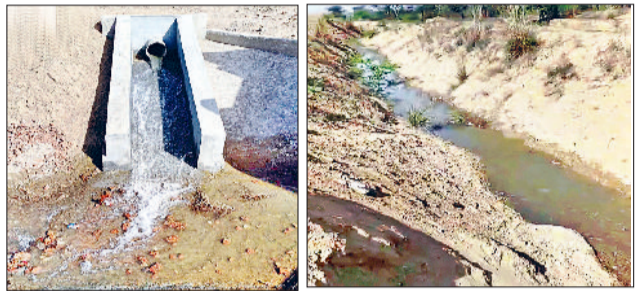
नारनौल। बदोपुर में पाइपलाइन दबाकर लाया गया नहरी पानी व बदोपुर की कच्ची ड्रेन में चलता नहरी पानी।

पहुंते हैं। मेले में ग्राम पंचायत व मेला कमेटी के अलावा प्रशासन का भी सहयोग रहता है। मेले की सुरक्षा व्यवस्था को लेकर कनीना सदर थाना ईंचां रामनाथ ने बताया कि मेले में सुरक्षा के उचित इंतजाम किए जाएंगे। पुलिस मास की त्रयोदशी को महाशिवरात्रि तथा सावन मास में त्रयोदशी को कांडव मेला शामिल है। सावन मास में यह मेला पखवाड़े भर चलता है जिसमें देश के विभिन्न हिस्सों से शिवभक्त