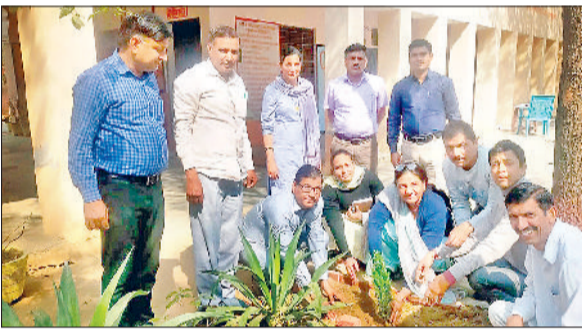
नारनौल। कांवी स्कूल में पौधरोपण करते हुए।