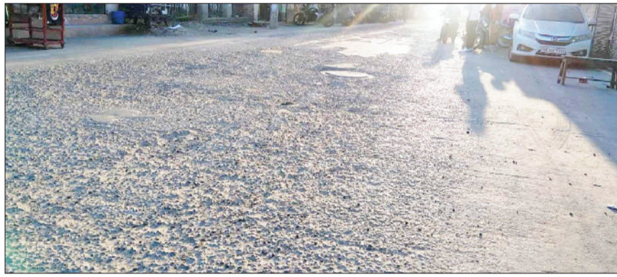
महेंद्रगढ़। सिनेमा रोड की सड़क की निकली हुई रोड़ियां।

शहर का सबसे व्यस्त मार्ग सिनेमा रोड इन दिनों जर्जर अवस्था में है। बालाजी चौक से माता मसानी तक सड़क मार्ग को बने दो साल भी नहीं हुआ है, लेकिन जगह-जगह सड़क मार्ग टूट कर बिखरने लगा है। सड़क में बने गहरे गड्ढे राहगीरों व वाहन चालकों के लिए परेशानी का सबब बनते जा रहे हैं। बता दें कि नगर पालिका की ओर से इस सड़क का 21 मार्च 2022 को काम शुरू हुआ था। जून 2022 में यह सड़क ठेकेदार ने बनाकर तैयार कर दी, लेकिन इस सड़क से पत्थर कंकड़ एक दिन में ही बिखरने लगे थे। इसको लेकर आसपास के दुकानदारों ने प्रशासन के प्रति नारेबाजी कर रोष जताया था तथा सड़क का दोबारा निर्माण करने की मांग उठाई थी। दुकानदारों ने आरोप