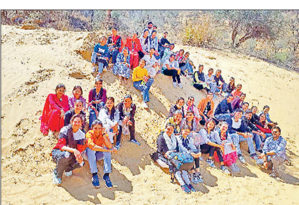
महेन्द्रगढ़। अरावली पहाड़ी का लुफ्त उठाती छात्राएं।