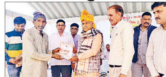
महेन्द्रगढ़। अंगदान पर नागरीकों को जागरूक करते छत्र।