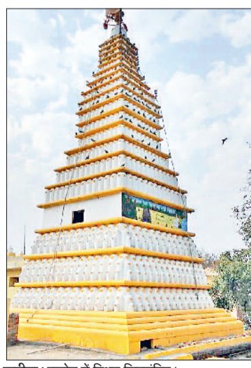
कनीना। बागोट में स्थित शिवमंदिर।